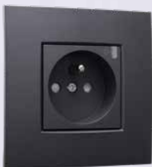
Geconnecteerd schakelbaar stopcontact

De solar mode van Niko Home Control zorgt ervoor dat geconnecteerde toestellen automatisch geactiveerd worden wanneer er te veel zonne-energie wordt opgewekt . Met een aantal huishoudelijke producten die veel energie verbruiken - denk aan je boiler, warmtepomp, elektrische fiets of wasmachine - is het voordeliger dan ooit om de gratis energie die je produceert, te gebruiken wanneer die beschikbaar is. Niko Home Control kan je helpen met het beheer van je apparaten op basis van je zelf opgewekte energie, waardoor jouw zelfconsumptie verhoogd wordt en jouw distributiekosten worden teruggeschoefd. Dat kan je bijvoorbeeld doen met geconnecteerde schakelbare stopcontacten of slimme stekkers die enkel geactiveerd worden wanneer er zonne-energie beschikbaar is .